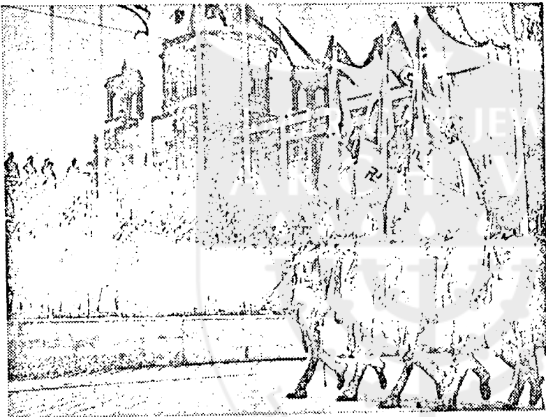
Hitler's army marches into Vienna

As he later recorded in "Mein Kampf": "Vienna was a hard school for me but it taught me the most profound beliefs of my life. . . .