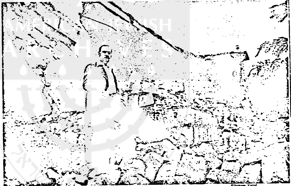
Naufal surveys the ruins: A commercial wasteland suddenly showing signs of life

again refer to Beirut as the "Paris of the Middle East." But the Lebanese capital, written off as a commercial wasteland only two months ago, is showing definite signs of life. Foreign businessmen are streaming back to the city by the plane-load, eager to learn what is left of offices and apartments they abandoned at the height of the civil war.