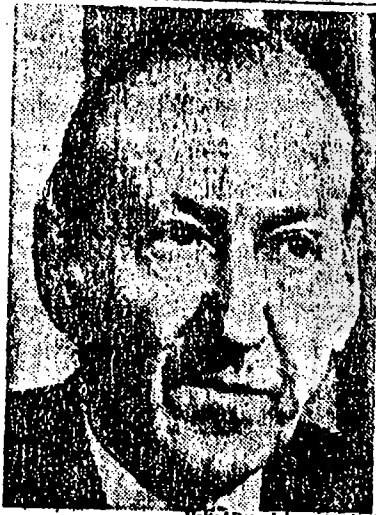
Secretary General Kurt Waldheim

backed resolution that is likely to be adopted by the General Assembly tomorrow.