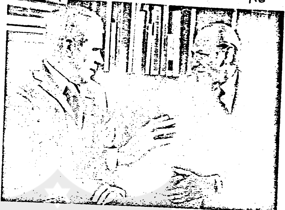
Waldheim with Vance: 'The two superpowers have given me their blessings'

—ANGUS DEMING with NICHOLAS PROFFITT in London