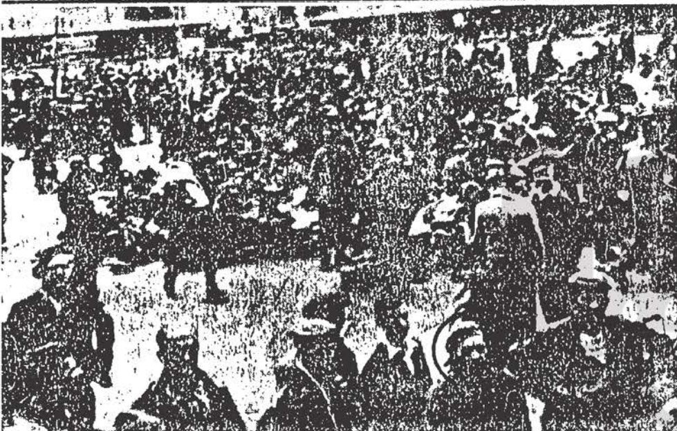
דער טאג פון דער באפרייאונג אין לאגער עבענזעי