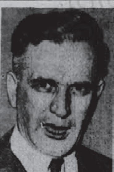
דאס איז דער פאג

היום פאר אידען אויסגעשטעלט זייערע רעזאלוציעס פאר אידען אויסגעשטעלט זייערע רעזאלוציעס פאר אידען אויסגעשטעלט זייערע רעזאלוציעס פאר אידען אויסגעשטעלט זייערע