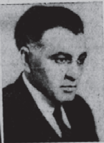
1999, 2000, 2001, 2002, 2003, 2004, 2005, 2006, 2007, 2008, 2009, 2010, 2011, 2012, 2013, 2014, 2015, 2016, 2017, 2018, 2019, 2020, 2021, 2022, 2023, 2024, 2025, 2026, 2027, 2028, 2029, 2030, 2031, 2032, 2033, 2034, 2035, 2036, 2037, 2038, 2039, 2040, 2041, 2042, 2043, 2044, 2045, 2046, 2047, 2048, 2049, 2050, 2051, 2052, 2053, 2054, 2055, 2056, 2057, 2058, 2059, 2060, 2061, 2062, 2063, 2064, 2065, 2066, 2067, 2068, 2069, 2070, 2071, 2072, 2073, 2074, 2075, 2076, 2077, 2078, 2079, 2080, 2081, 2082, 2083, 2084, 2085, 2086, 2087, 2088, 2089, 2090, 2091, 2092, 2093, 2094, 2095, 2096, 2097, 2098, 2099, 2100, 2101, 2102, 2103, 2104, 2105, 2106, 2107, 2108, 2109, 2110, 2111, 2112, 2113, 2114, 2115, 2116, 2117, 2118, 2119, 2120, 2121, 2122, 2123, 2124, 2125, 2126, 2127, 2128, 2129, 2130, 2131, 2132, 2133, 2134, 2135, 2136, 2137, 2138, 2139, 2140, 2141, 2142, 2143, 2144, 2145, 2146, 2147, 2148, 2149, 2150, 2151, 2152, 2153, 2154, 2155, 2156, 2157, 2158, 2159, 2160, 2161, 2162, 2163, 2164, 2165, 2166, 2167, 2168, 2169, 2170, 2171, 2172, 2173, 2174, 2175, 2176, 2177, 2178, 2179, 2180, 2181, 2182, 2183, 2184, 2185, 2186, 2187, 2188, 2189, 2190, 2191, 2192, 2193, 2194, 2195, 2196, 2197, 2198, 2199, 2200, 2201, 2202, 2203, 2204, 2205, 2206, 2207, 2208, 2209, 2210, 2211, 2212, 2213, 2214, 2215, 2216, 2217, 2218, 2219, 2220, 2221, 2222, 2223, 2224, 2225, 2226, 2227, 2228, 2229, 2230, 2231, 2232, 2233, 2234, 2235, 2236, 2237, 2238, 2239, 2240, 2241, 2242, 2243, 2244, 2245, 2246, 2247, 2248, 2249, 2250, 2251, 2252, 2253, 2254, 2255, 2256, 2257, 2258, 2259, 2260, 2261, 2262, 2263, 2264, 2265, 2266, 2267, 2268, 2269, 2270, 2271, 2272, 2273, 2274, 2275, 2276, 2277, 2278, 2279, 2280, 2281, 2282, 2283, 2284, 2285, 2286, 2287, 2288, 2289, 2290, 2291, 2292, 2293, 2294, 2295, 2296, 2297, 2298, 2299, 2300, 2301, 2302, 2303, 2304, 2305, 2306, 2307, 2308, 2309, 2310, 2311, 2312, 2313, 2314, 2315, 2316, 2317, 2318, 2319, 2320, 2321, 2322, 2323, 2324, 2325, 2326, 2327, 2328, 2329, 2330, 2331, 2332, 2333, 2334, 2335, 2336, 2337, 2338, 2339, 2340, 2341, 2342, 2343, 2344, 2345, 2346, 2347, 2348, 2349, 2350, 2351, 2352, 2353, 2354, 2355, 2356, 2357, 2358, 2359, 2360, 2361, 2362, 2363, 2364, 2365, 2366, 2367, 2368, 2369, 2370, 2371, 2372, 2373, 2374, 2375, 2376, 2377, 2378, 2379, 2380, 2381, 2382, 2383, 2384, 2385, 2386, 2387, 2388, 2389, 2390, 2391, 2392, 2393, 2394, 2395, 2396, 2397, 2398, 2399, 2400, 2401, 2402, 2403, 2404, 2405, 2406, 2407, 2408, 2409, 2410, 2411, 2412, 2413, 2414, 2415, 2416, 2417, 2418, 2419, 2420, 2421, 2422, 2423, 2424, 2425, 2426, 2427, 2428, 2429, 2430, 2431, 2432, 2433, 2434, 2435, 2436, 2437, 2438, 2439, 2440, 2441, 2442, 2443, 2444, 2445, 2446, 2447, 2448, 2449, 2450, 2451, 2452, 2453, 2454, 2455, 2456, 2457, 2458, 2459, 2460, 2461, 2462, 2463, 2464, 2465, 2466, 2467, 2468, 2469, 2470, 2471, 2472, 2473, 2474, 2475, 2476, 2477, 2478, 2479, 2480, 2481, 2482, 2483, 2484, 2485, 2486, 2487, 2488, 2489, 2490, 2491, 2492, 2493, 2494, 2495, 2496, 2497, 2498, 2499, 2500, 2501, 2502, 2503, 2504, 2505, 2506, 2507, 2508, 2509, 2510, 2511, 2512, 2513, 2514, 2515, 2516, 2517, 2518, 2519, 2520, 2521, 2522, 2523, 2524, 2525, 2526, 2527, 2528, 2529, 2530, 2531, 2532, 2533, 2534, 2535, 2536, 2537, 2538, 2539, 2540, 2541, 2542, 2543, 2544, 2545, 2546, 2547, 2548, 2549, 2550, 2551, 2552, 2553, 2554, 2555, 2556, 2557, 2558, 2559, 2560, 2561, 2562, 2563, 2564, 2565, 2566, 2567, 2568, 2569, 2570, 2571, 2572, 2573, 2574, 2575, 2576, 2577, 2578, 2579, 2580, 2581, 2582, 2583, 2584, 2585, 2586, 2587, 2588, 2589, 2590, 2591, 2592, 2593, 2594, 2595, 2596, 2597, 2598, 2599, 2600, 2601, 2602, 2603, 2604, 2605, 2606, 2607, 2608, 2609, 2610, 2611, 2612, 2613, 2614, 2615, 2616, 2617, 2618, 2619, 2620, 2621, 2622, 2623, 2624, 2625, 2626, 2627, 2628, 2629, 2630, 2631, 2632, 2633, 2634, 2635, 2636, 2637, 2638, 2639, 2640, 2641, 2642, 2643, 2644, 2645, 2646, 2647, 2648, 2649, 2650, 2651, 2652, 2653, 2654, 2655, 2656, 2657, 2658, 2659, 2660, 2661, 2662, 2663, 2664, 2665, 2666, 2667, 2668, 2669, 2670, 2671, 2672, 2673, 2674, 2675, 2676, 2677, 2678, 2679, 2680, 26

אויס 1887 איז נישט צו נאכמאלירען שטאטס פון אידען איבער דער וועלט, ואנט דא קאמיטע וועלען פילייבט פארלאנגען דערשטעוונג פון סטייט-דעפארט