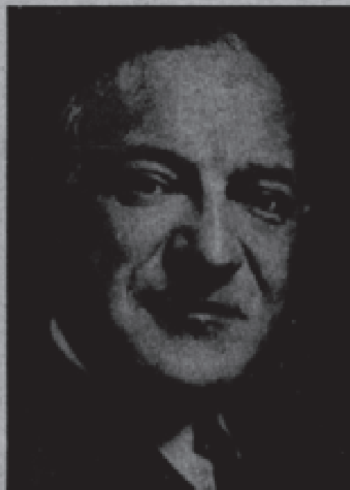
Senator Robert F. Wagner