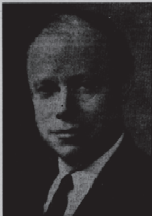
Sen. Robert A. Taft

"Those Jews who were fortunate enough to be in Palestine have made and are making a truly glorious contribution to the Allied cause. While General Montgomery and his valiant Eighth Army were fighting with their backs to the Suez Canal, and Rommel already had invited guests to his contemplated first dinner party in Cairo, the Jews of Palestine were performing heroic deeds as commandos and as other shock troops. In Palestine the entire community of men and women dedicated their lives to the defense of their homeland and to the production of urgently needed materials of war for the Allied forces. President Roosevelt, Mr. Churchill, and other Allied leaders have spoken most generously of their contribution.