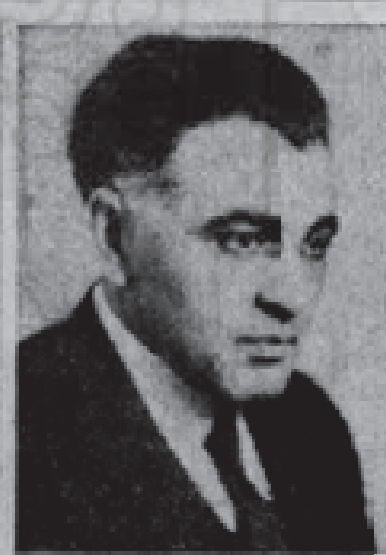
דאס איז דער פאג