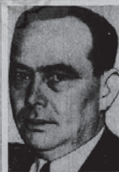
דאס איז דער פאג