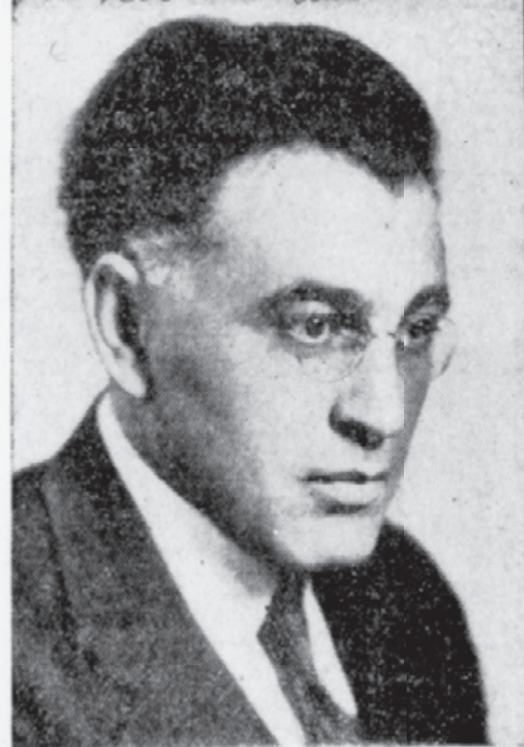
ABBA HILLEL SILVER

He is an ardent Zionist and has been increasingly active in the efforts to establish a Jewish homeland. But that which lies deepest