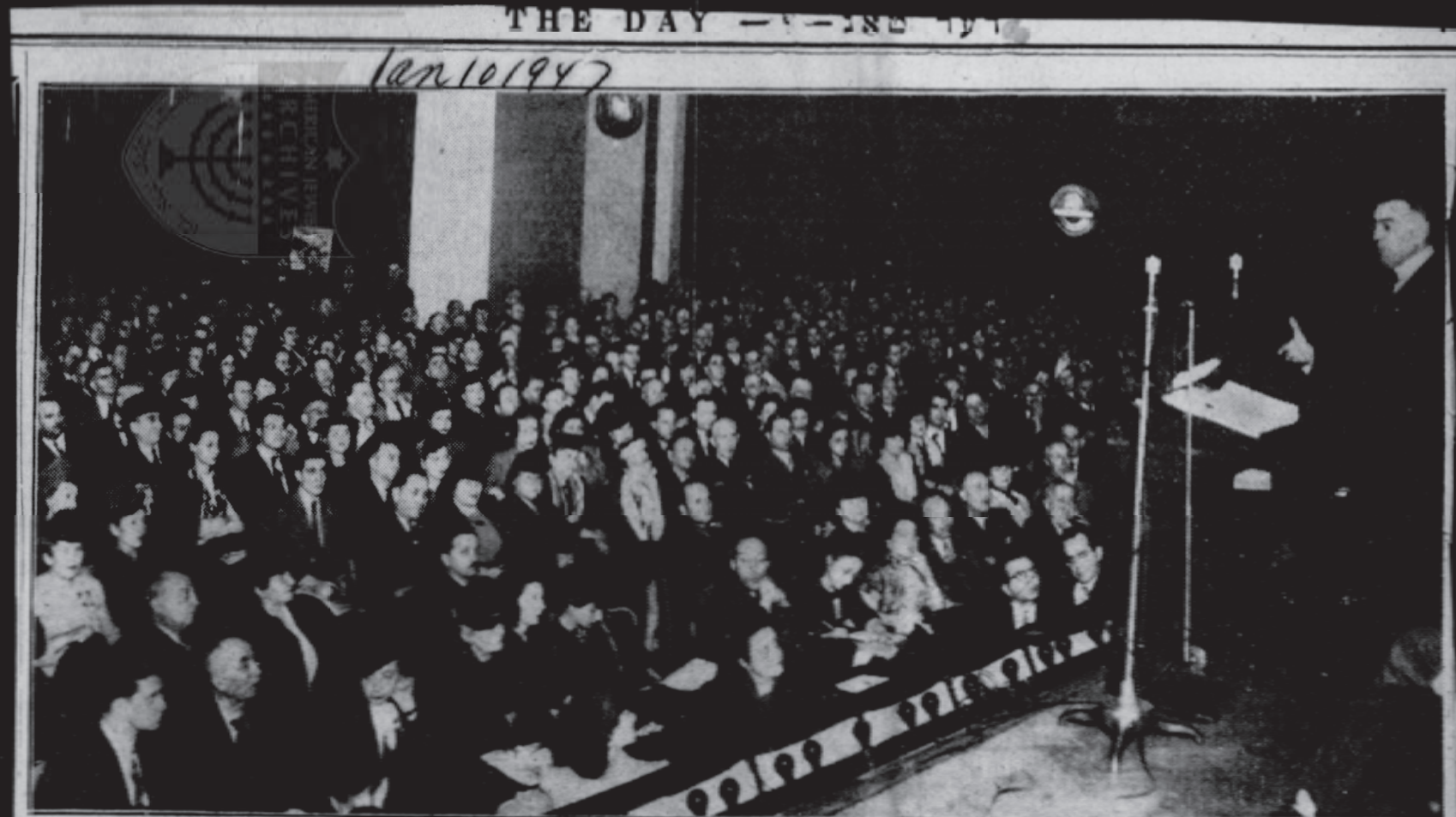
דר. אבא הלל סילווער, פירער פון אמעריקאנער ציוניסטן, ווערט דא געוויזען אויף דער בינע אין מאנהעטען צענטער, 34 סטריט און 8 טע עוו. ווען ער האט אפגעזעכען א באריכט פון דעם באזעלער ציון קאנגרעס.

Is it possible that the situation changed when the critic himself became part of the machine? And when Rabbi Wise describes the last Congress as "a collection of personal hatreds, and rancors, and private ambitions," can he exclude himself altogether?