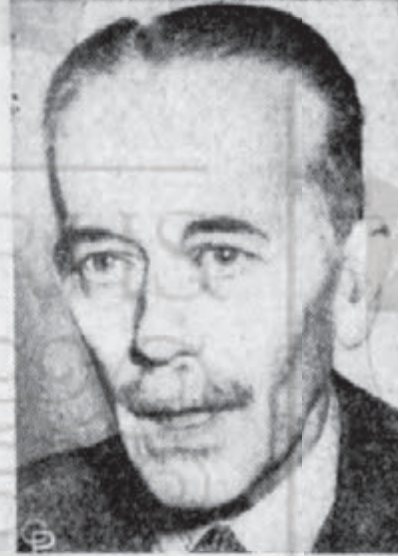
סער אלעקסאנדער קאדאגאן פארשטעלעט מיט ווען וועגן ארץ-ישראל