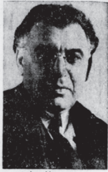
דר. אבא הלל סילווער

צווייטער ארגאניזאציע, און און דערע מיטגלידער פון דער ציוניסט שער דעלעגאציע, וואס האט זיך נאך "וואס צוריקגעקערט פון בא" זעל. דר. איראעל גאלדשטיין, נע- ווענער פרעזידענט פון דער ציוניסט טייטש ארגאניזאציע אין אמעריקע און ניידער-וויילטער פרעזידענט פון דער וועלט-קאנפערענץ פון ארגעמיינע ציו- ניסטען, וועט זיין דער פארזיצער פון דעם מאססינג הייז אווענט אין מאנהעטן סענטער, איינשריט אין פריי- פאר יעדען. דער הייזטיגער קבלת פנים פאר דער דעלעגאציע איז דעווארט געווא- רען מיט דער גרעסטער שפאנונג פון אלע אידען, ווען דר. סילווער, וועלכער איז געשטענען געווארן דער ציריפונקט פון אטאקעס פון דער ענגלישער רעגיר- ונג פאר זיין דרויסטער שטעלונג אויף דעם ציוניסטישן וועלט-קאנ- גרעס, וועט באקאנט מאכען וועגן זא- כען, וואס זיינען פארגעקומען אויף דעם קאנגרעס און וועלכע זיינען נאך ניט אויפגעקלערט געווארען. דר. סיל- ווער, וועלכער האט דערהיינט צו דעם זא אן אפטיילונג פון דער אידישער אנענטיר זאל געגרינדעט ווערען אין אמעריקע און וועלכער איז ניט אוועק אויף א שריט צוריק פון זיין פעסטער פאדערונג פאר א אידישע מלוכה אין ארץ ישראל, וועט פיל האבען צו זאגן וועגען די אטאקעס, וואס זיינען גע- הערט געווארען קעגען אים און וועגען דעם ווייטערדיגן פראגראם צו פארמי- רען א אידישע מלוכה אין ארץ-ישראל. די אנדערע ציוניסטישע מיטגלידער פון דער דעלעגאציע, וועלכע זיינען גע- שטאנען פאראייניגט אין דעם קאמפ- פאר א זעלבסטשטענדיגער מלוכה אין ארץ ישראל בעת די וועגען אויף דעם 22טען וועלט-קאנגרעס, וועלען אויך פיל באריכטען. טיקעס קען מען נאך קריגען אי- נאם פון דער ציוניסטישער ארגאניזא- ציע, 41 איסט 42טע סטריט.