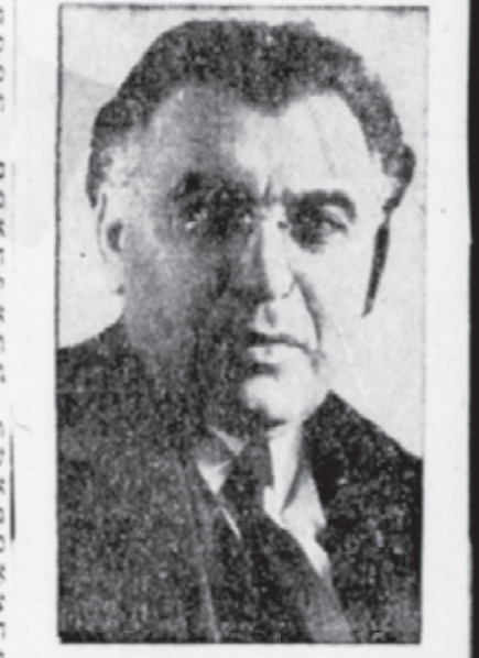
דר. אבא הילל סילווער

דער אמעריקאנער ציונים האט פיליטענדיג געזיגט ביי דעם לעצטען ציוניסטישן קאנגרעס און וועט ער ריכטערן צו די הערצל-אידיען פון קלאסישע ציונים, האט ראבאי סילווער געזאגט, דער ניו יארק אויסגעוויילטער טשעירמאן פון דער אמעריקאנער סעקציע.