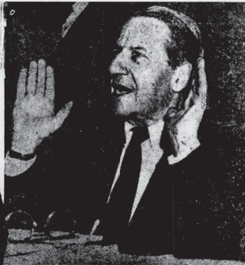
RABBI STEPHEN WISE

In our issue of January 10th, we published the cabled news of Rabbi Stephen Wise's resignation from office in the Zionist Organisation of America, and the furore caused by his scathing condemnation of Congress and the tactics pursued in Basle by the Silverite section of American Zionism. We have now received from the New York correspondent of the "S.A. Jewish Times" the full text of a Sabbath eve address Rabbi Wise delivered to his congregation at the Free Synagogue, New York, in which he details the reasons for his resignation. The text reads as follows: