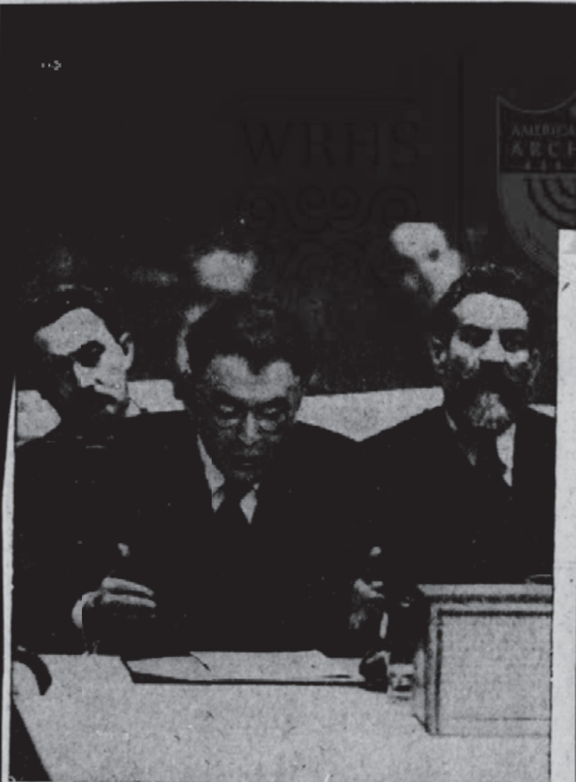
האָט געמאַכט טיפֿען איינדרוק ביי יידען קאָמיטע מיט זיין רעדע וועגען אידען און ארץ ישראל. — דר. אבא הלל סילווער, הויפט פון דער אמע-ריקאַנער אַפּטיילונג פון אידישער אַגענטור, ווערט פאַרגעשטעלט צייט האַלטען זיין רעדע פאַר דער ספּעציעלער יידען קאָמיטע. דר. סילווער האָט ערקלערט, אז די אַגענטור שטימט אַפּיציעל אַין צו אַ צוטיילונג פון ארץ ישראל, כאַטש זי טוט דאָס מיט אַ שווערער האַרץ. DELEGATES IMPRESSED. — Dr. Abba Hillel Silver (center), chair- man of American section of the Jewish Agency, is pictured telling special U. N. committee that Agency officials accept the proposed partition of Palestine while it asks for certain changes. FORWARD 10-4-47