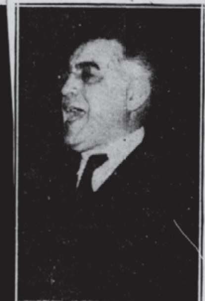
RABBI ABBA HILLEL SILVER He Spoke for Israel.

תל אביב, כ"א תשרי תש"ח. דברי ד"ר סילבר תפקיד הכרזתו של ד"ר אבא הלל סילבר בפני הועדה המיוחדת של אר"ם היה, למ' סור למוסד הבינלאומי הודעת רשמית על עמדת התנועה הציונית כלפי הצעות ועדת המקדמה, ואת תפקיד זה קיים בכבוד, כחונתה לא היתה להפתיע מישהו או להצי' טיין במליצות מבריקות ומלוטשות, אלא להכריז בבהירות ובמתינות, בהחלטיות ובצורה שאינה משתמעת לשתי פנים, מה שהיה כבר ידוע בקהלים כלליים: שהתנועה הציונית מסכימה להכניעת החלוקה, כפי ש' היא צויינה בהחלטות הרוב, לרבות ההצ' עזת בדבר איתנו כלכלי בין שתי המדינות המוצעות, על אף הקרבתו הרבים הכרוכים בה. ההסכמה להכניעת החלוקה הובעה ללא תנאי, ורק בהוכיחו את האיתור הכלכלי, התנה ד"ר סילבר, שהמדינה היהודית תח' זיק בידיה אותם המכשירים לפיתוח כלכלי וסינונים נדרושים לעליה יהודית בממדים גדולים" ושתהיה לה, ג'שה חפשיה ועצ' מאית למקורות ההון והאספקה ההכרחיים להשגת מטרות אלו."