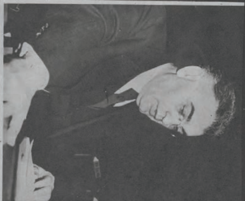
V. XXI pt. 5

Johnson's statement left completely open, however, the question of whether American dollars and fighting forces would be sent to Palestine in support of a UN decision if the Arab states carried out their threat to wage war against partition.