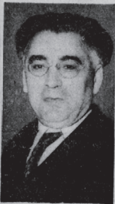
Rabbi Abba Hillel Silver

Dr. Silver, at Assembly Hearing, Says Jewish Agency Acts Reluctantly