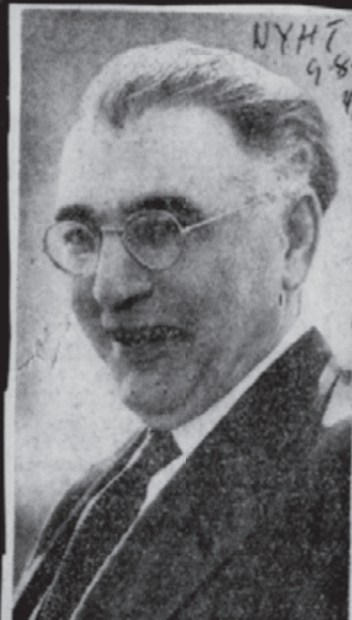
Dr. Abba Hillel Silver, chairman of the American section of the World Zionist Organization, returning from Israel.

The liner docked at 2:30 P. M. at Pier 90, North River, with 2,271 passengers from Cherbourg and Southampton.