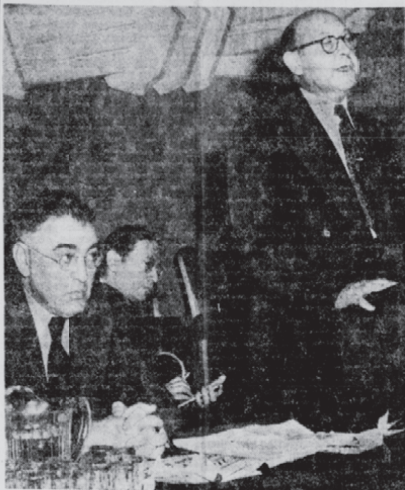
Rabbi Israel Goldstein addressing ZOA Administrative Council at the Hotel Pennsylvania. Dr. Abba Hillel Silver is on the left.