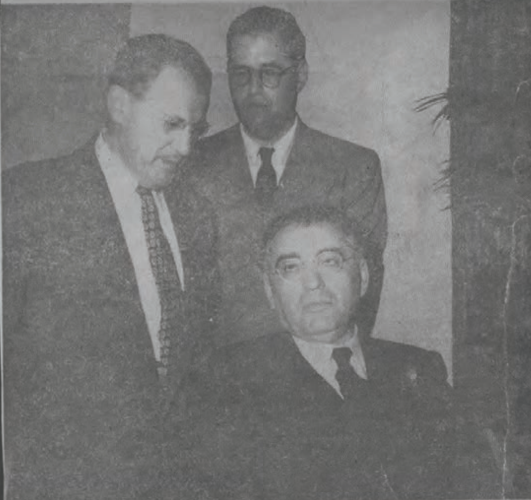
HONORS FOR RABBI SILVER. Dr. Abba Hillel Silver, rabbi of the Temple and a world leader in the Zionist movement which has made a nation of Israel, was the honored guest last night in Hotel Cleveland when 1,000 paid tribute to his 31 years of community service. Shown with Dr. Silver, seated, are Dr. Emanuel Neumann, president of the Zionist Organization of America (left), and Maj. Aubrey S. Eban, Israel's delegate to the United Nations.