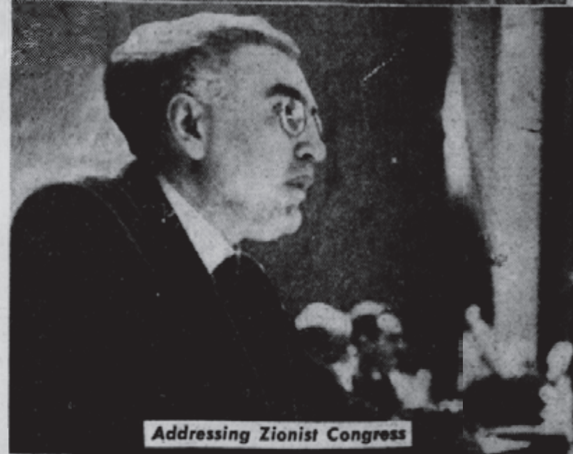
Addressing Zionist Congress