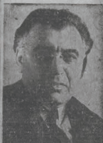
דר. אבא הלל סילווער ציוניסט, פירער, ווייזע פון ישראל

ספעציעלער באזוכער, אלס פון צ. ה. דובין נעכטען, 3:30 נאכמיטאג, איז אין דעם ישראל קאנסולאט, 16 איסט 86סטע סטריט, ניו יארק, פארגעקומען אן איינציקסטע צערעמאניע, ארמור לוריע, דער קאנסול פאר ישראל אין ניו יארק, האט געגעבן צו דר. הלל סילווער, ציוניסטישער אסירקאנער און הויפט פון אידישער אגענטור דא אין לאנד, די ערשטע אפיציעלע וויזע, נומער איינס, נעכטען דאס איז דער ערשטע וויזע צו באזוכען ישראל אלס אסירקאנער בירגער. אונטערשטריכט ביי דער צערעמאניע וויין נען געווען פארשטייער פון א ריי וויכטיגע ארגאניזאציעס, פון דער ענגלישער און אידישער פרעסע, ווען די אפיציעלע וויזע איז געשטעמפלעט געווארען און איבערגעגעבן דעם ציון פירער אין דער האנט. דאס מען פארשייבט ווערען, אן כ"א חשוון, יאר תש"ח, אסענען הנדערט און ווייזע אן אפיציעל יאר נאך דעם