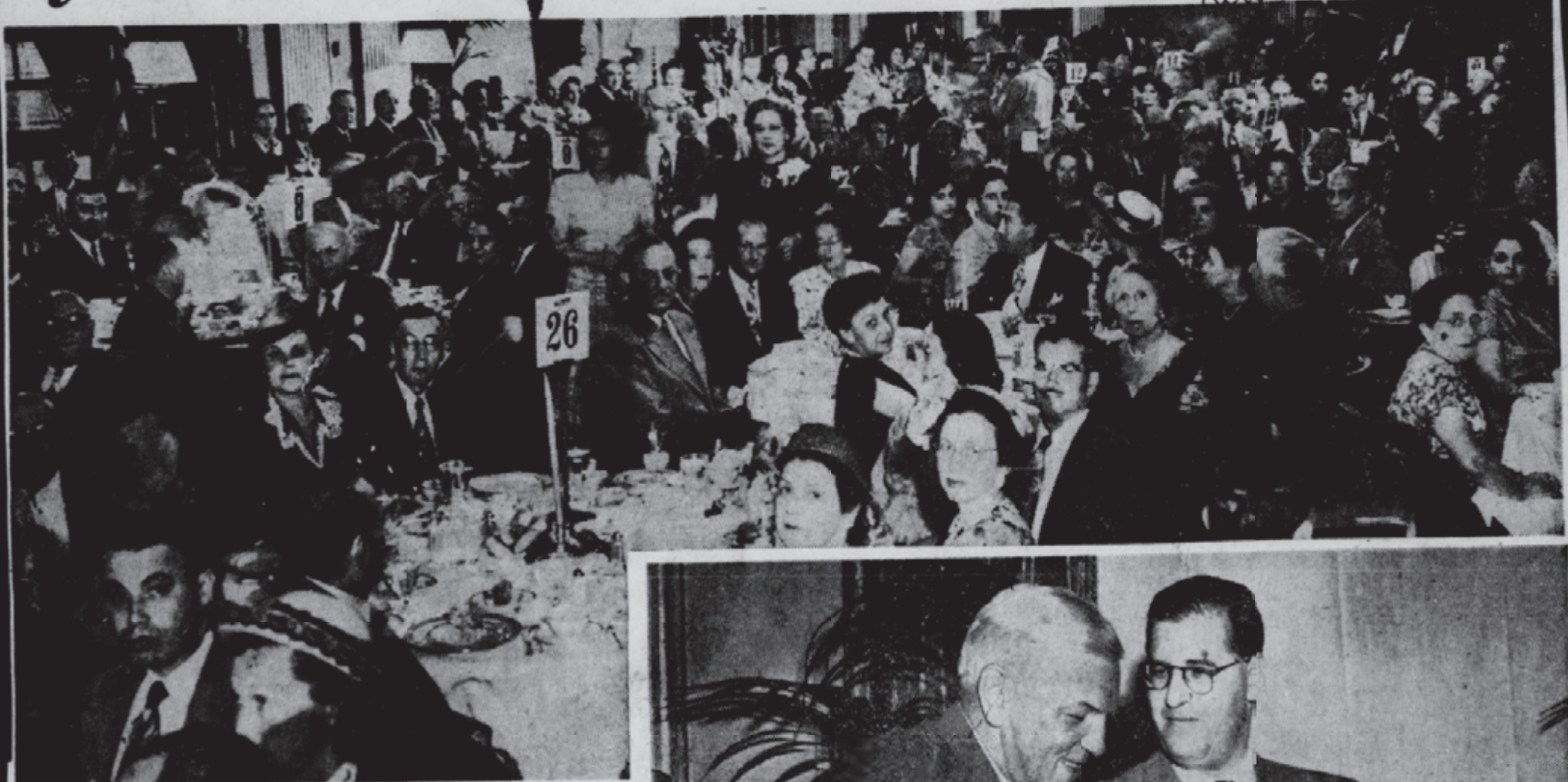
Part of the throng of 1,000 well-wishers at the dinner for Dr. Abba Hillel Silver at Hotel Cleveland