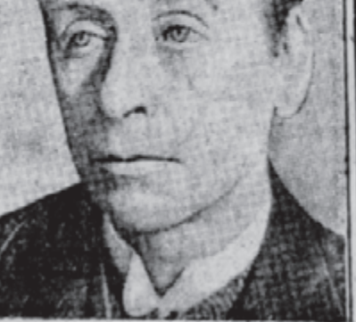
סער ווינדהעם דירס

אויף דער קאנווענשאן וועלען אויפ-גענומען ווערען ווערן ערנסט פראג-לעמען, וואָס וועלען דעצידירען פון איין זייט די באציאונגען פונ'ם אמערי-קאנער אידענטום צו ישראל און פון דער צווייטער זייט וועט דאס פראגראם פון דער ציוניסטישער ארגאניזאציע אין גאנצען איבערגעבויט ווערען.