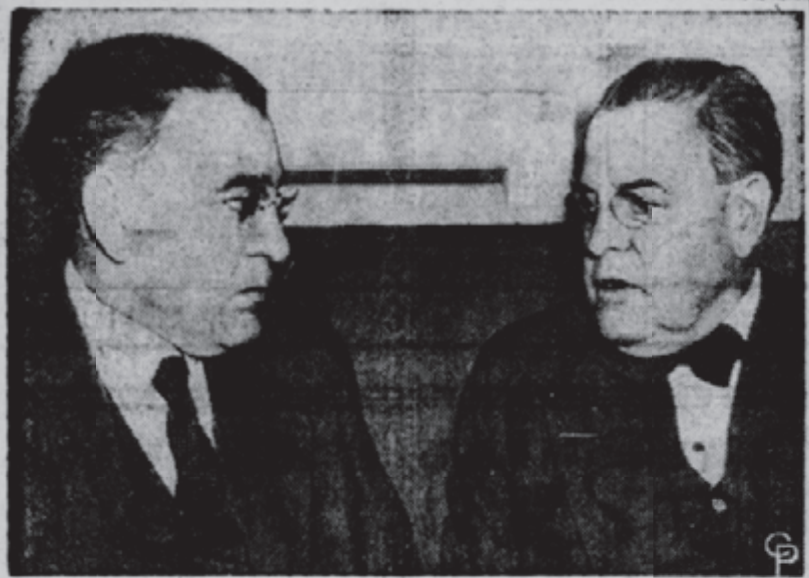
ד"ר. אבא הלל סילווער קאנפערירט איז ירען מיט דעם הויפט פון דער אמעריקאנער דעלעגאציע, סענאטאר אוסטין.