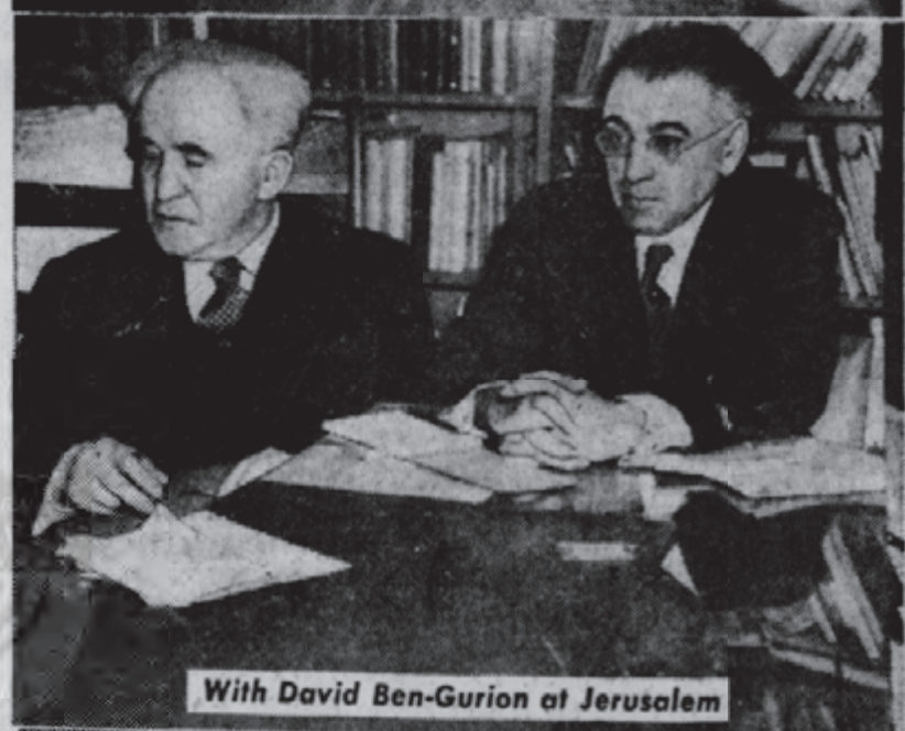
With David Ben-Gurion at Jerusalem