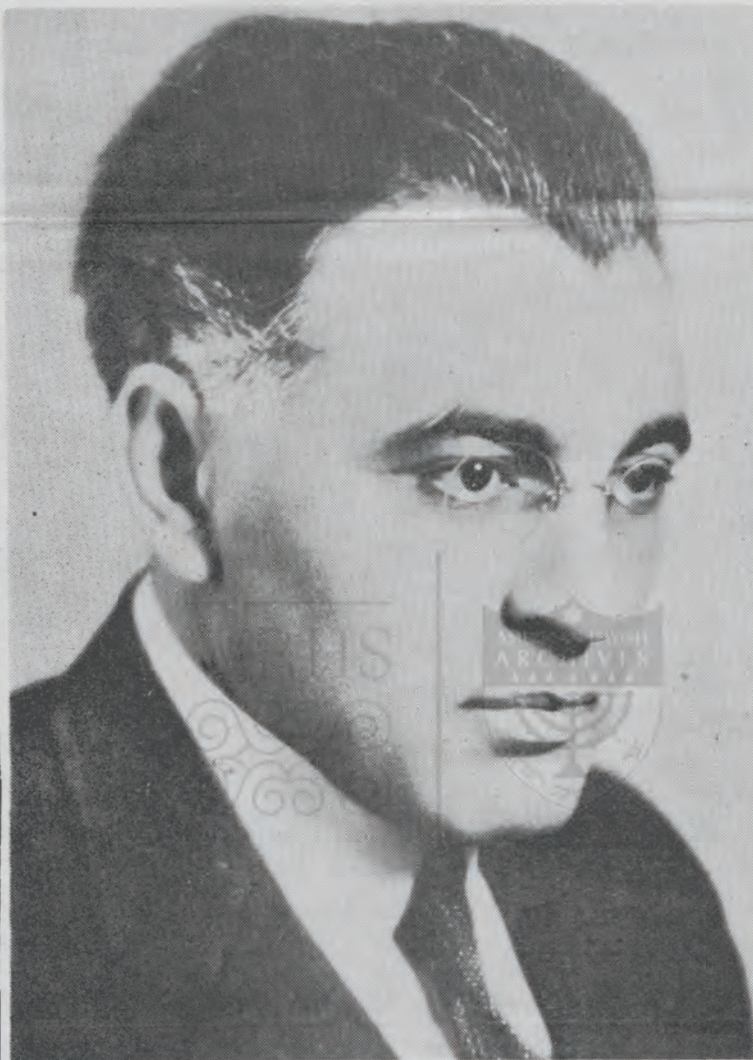
DR. ABBA HILLEL SILVER

Born—Lithuania 1893; received his A.B. from U. of Cincinnati 1915; rabbi Hebrew Union College, 1915, D.D. 1925; Litt. D., Western Reserve, 1928; D.H.L., Hebrew Union College, 1941; Rabbi The Temple, Cleveland from 1917; Chairman American Section Jewish Agency for Palestine; President of Zionist Organization of America; Chairman and Co-Chairman, United Palestine Appeal (1938-'43); United Jewish Appeal (Co-Chairman); National Chaplain Jewish War Veterans; Charter member Ohio Race Betterment Assn.; Member Bd. Cleveland Chap. Red Cross; V. P. Jewish Acad. Arts and Sciences; served as University preacher at Harvard, Cornell, U. of Chicago, Syracuse and Purdue; in France during World War; Ohio Com. on Unemployment Problems of the Negro; author.