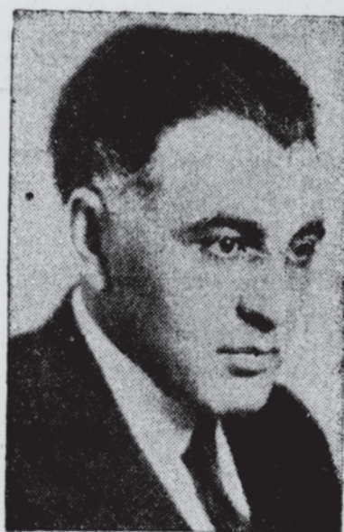
ד"ר. אבא הלל סילווער

דער וועלט בארימטער אידישער שטאטסמאן און פריינט פון פרעזידענט ווילסאן און פרעזידענט רוזוועלט זאגט: