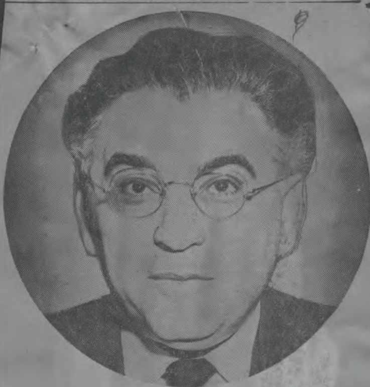
Dr. Abba Hillel Silver