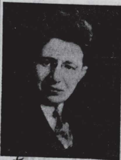
ABBA HILLEL SILVER ... asks the same