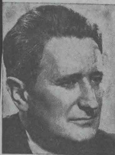
ד"ר נחום גלדמאן

דער אידישער איינפלוס ווערען אויף דעם איינגאנג פון די באשלוסן. דער אידישער דעלעגאט פון פוילען, ד"ר יוליוס קאזימוב, האט שטארק אונטערשטיצט די שטעלונג פונ'ם אראבישען פירער, און פארטיידיגט דעם פארשלאג אז דער מיטלען פון דעם טראכטיג-פאנאמאניזם זאל פארקויפט אין דער שווייץ. ד"ר קאזימוב האט אויסגעלאזט א פארשלאג וואס איז געמאכט געווארען פון דעם דער לעגאט פון נייזעלאנד, ס'ער קארל בערענדסאן, אז די אסעמבלי זאל נישט גוטהייסען די סומע פון 36 מיליאנען דאלער, וואס דער יידען בורזשעס פאר קומענדיגען יאר האט לעצטענס באר שטימט פאר דעם צוועק, אז דער