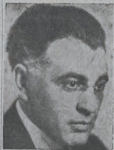
דאבאי אבא הלל סילווער

פון ארץ ישראל האבען עס געמוזט דורכפירען מיט זייער בלוט, וואס זיי האבען פארגאסען אינ'ם קאמף קעגען די אראבישע מלכות, וואס האבען זיך