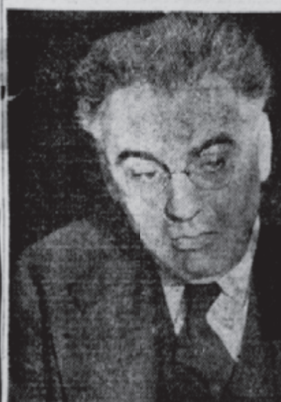
DR. ABBA H. SILVER Coming Back