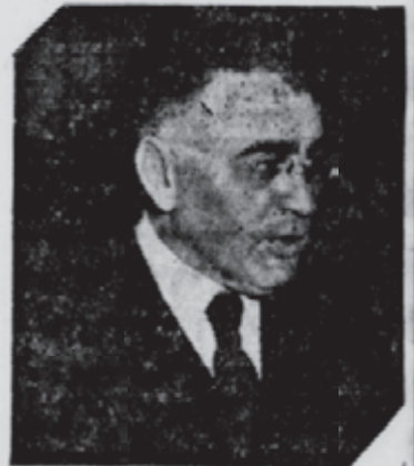
ד"ר נחום גולדמן, ראש הוועדה הציונית

הוא היה גדולי-הנואמים בעם העברי ולהפסדותיו חוכו כלהצגת-בכורה גראנד דיווית. הדבר הוא נסתכל לבית-עולמו. מכל הפליאה היה נשאר רק הדבר ווייצמן שלא יכול היה עוד לביא הפעם לקונגרס ולהשמיע את דבריו. ושאר הנואמים שנשארו בחיים ומולם הטוב שיחק להם לארואת את החזון הציוני בהתגשמותו. יושבים על הבמה בספסל ליום האחרון, מאזינים ומקשיבים, אך סטאטיסטיים הם על הבמה. אפילו הסקורד משנה אינם ניתנים להם. כי עיניהם הר פיעו על הבמה. אבל אין בהם כוחות מכריעים. ימים אחדים ישבנו בקונגרס והאזנו לנואמים רבים. היו בהם טובים ומחזות טובים, אך נאומים, ועשייה-טור ריה"א נשמעו. כולם חזרות פחות או יותר נוצלות של רעיונות ידועים. לכן התהלכתי הצופים ו-עיקמא על חטמיהם: משעמם! אין רמה נאותה, — אמרו.