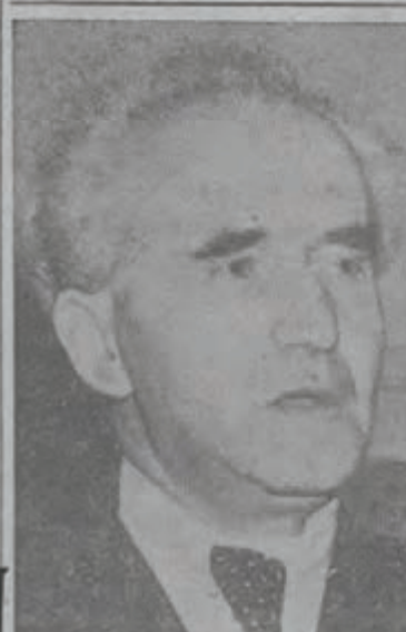
DAVID BEN GURION

The conflict has been marked by the emergence of Rabbi Abba Hillel Silver and Prime Minister David Ben-Gurion as spokesmen