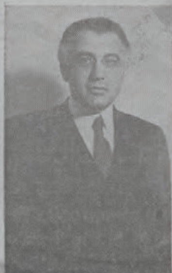
DR. ABBA HILLEL SILVER

Speaking from the spacious King David Hotel, Dr. Silver, in one of his rare interviews with the