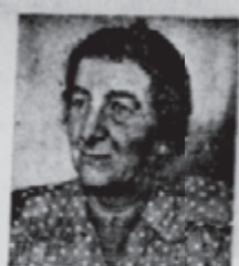
גולדה מאירסון, את מורידה את רמת הקונגרס

השעה היתה קרוב לתצות, בן מור סילבר את נאום. הגיע זמן נעילת הישיבה, כשם שהיה בערב לפני כן. תמול ושלשום. לפתע ניתנה רשות-הדבר בור לגברת גולדה מאירסון. איש לא הבחין מראש. כי שרת העבודה יושבת על הבמה ואורבת למרפא. איש לא העי לה על הדעת. כי מפלגתה הטיה עליה