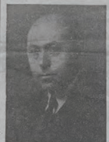
DR. ISRAEL GOLDSTEIN

The effect of the Goldstein statement was interpreted by observers here as a rejection of