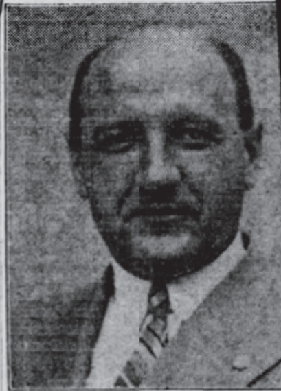
ELIEZER KAPLAN Israel's Finance Minister

After a stormy meeting of the Israeli Cabinet, attended by both Mr. Henry Morgenthau Jr. and