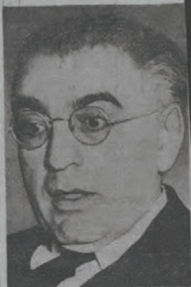
Rabbi Abba Hillel Silver

Rabbi Abba Hillel Silver, former president of the Zionist Organization of America and one of the top spokesmen for American Judaism, predicted a bright future last night for the American Jewish community.